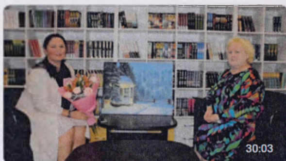
Беседа-интервью «Живопись поднимает энергетику в разы...»

Центральная модельная библиотека организовала онлайн проект «Встречи с интересными людьми». Цель проекта познакомить со знаменитыми людьми, живущими в районе или выходцами из района и прославившими его. Беседы проходят в форме интервью. В ходе беседы зрители знакомятся с биографией знаменитых людей района, интересными фактами их жизни, об общественной деятельности.