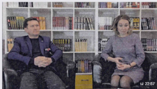
Час патриота "Эхо афганских гор"