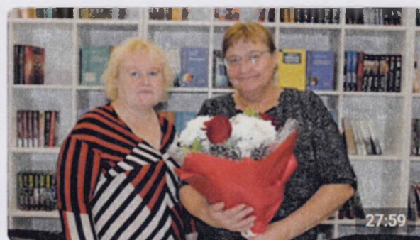
Актуальный диалог «Современное образование»

Центральная библиотека с.Языково 597 просмотров - три месяца назад